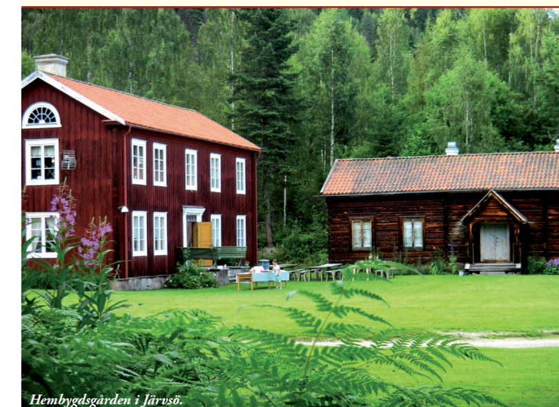
Hembygdsgården i Järvsö.

Tryck & Produktion: ul roma tryck, Ljusdal - 0651-160 20